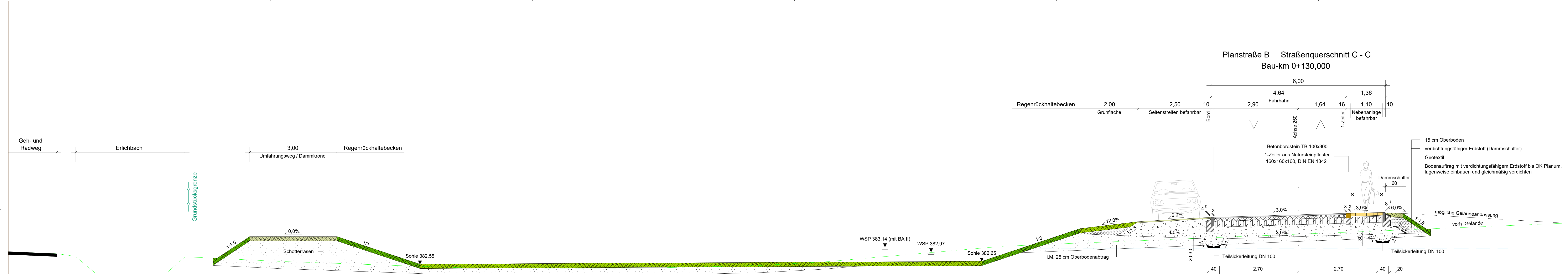
Planstraße B Straßenquerschnitt C - C Bau-km 0+130,000